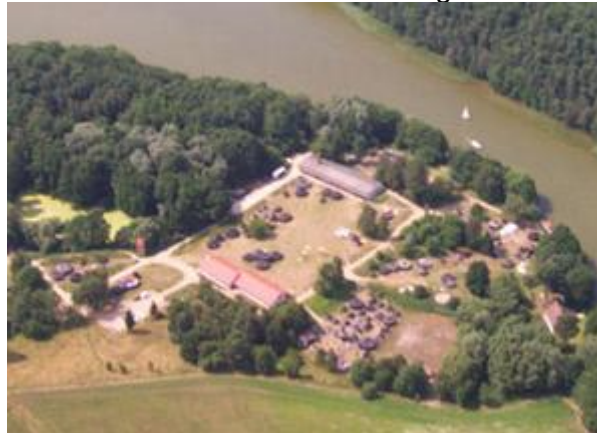
Ein Blick auf das Pfadfindergelände